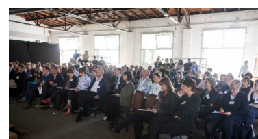
Blick ins Publikum