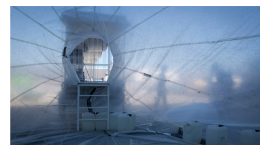
Mobile, temporäre Architekturinstallation von on/off architects

Alle Bilder stammen von der Tagung am 07.05.2018 und sind von Florian Büttner.