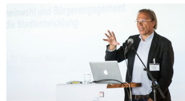
Impulsvortrag von Harald Welzer (Futur Zwei)