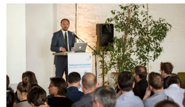
Grußworte vom Parlamentarischen Staatssekretär des BMI Hr. Wanderwitz

Projektauftrag „Stadt gemeinsam gestalten!“: http://www.nationale-stadtentwicklungspolitik.de/NSP/DE/Projekte/Projektauftrag/ProjektauftragGemeinsamGestalten/projektauftrag_node.html