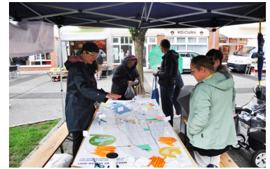
Bürgerumfrage auf dem Marktplatz

https://www.velten.de/cms/verwaltung-und-politik/stadtmarketing/