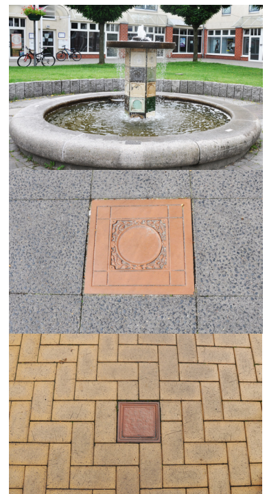
Gestaltungselemente, die die Geschichte und Industriekultur aufnehmen